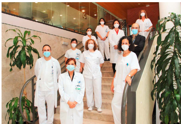
Grupo de investigación en cuidados (GIC) - IDISSC.